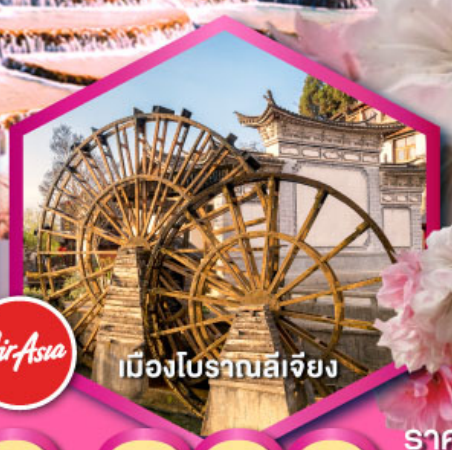
เมืองโบราณลีเจียง