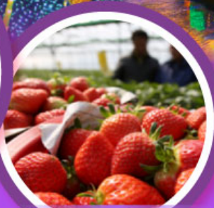
เก็บสตรอว์เบอร์รี่