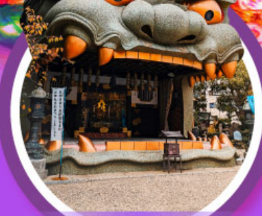
ศาลเจ้านิมบะ ยาชากะ