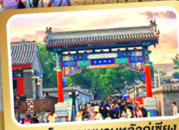
ถนนโบราณหนานหลวู่เกีเซียง