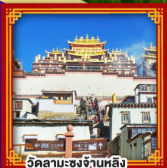
วัดลามะชงจ้านหลิ่ง