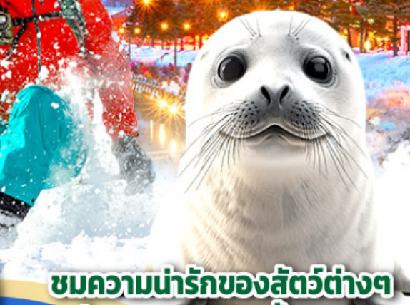
ชมความน่ารักของสัตว์ต่างๆ ที่พิพิธภัณฑ์สัตว์น้ำโอตารุ