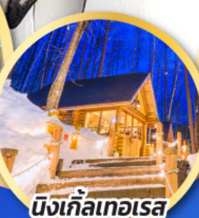
นิงเกิ้ลเทอเรส