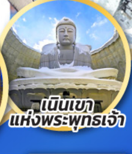
เป็นเขา แห่งพระพุทธรเจ้า