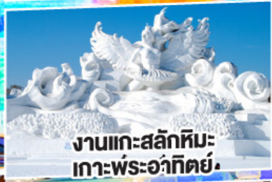
งานแกะสลักหิมะ เกาะพระอาทิตย์