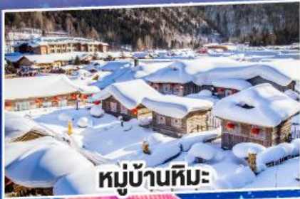
หมู่บ้านหิมะ