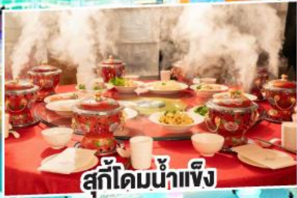
สุกี้ไคมน้ำแข็ง