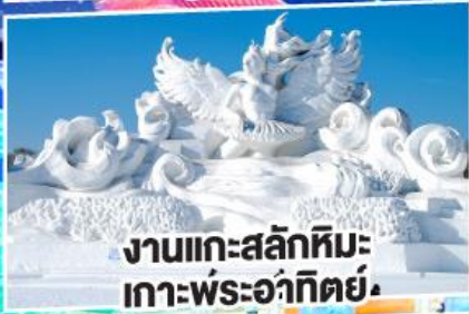
งานแกะสลักหิมะ เกาะพระอาทิตย์