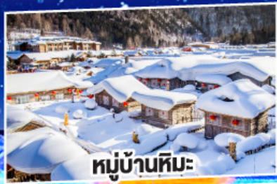
หมู่บ้านหิมะ