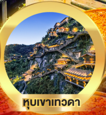
หุบเขาเทวดา