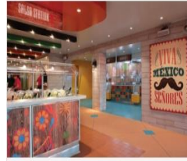
EL LOCO FRESH