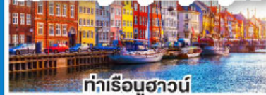
ท่าเรือฮาวน์

ล่องเรือสำราญสุดหรู DFDS พร้อมห้องพักแบบ Sea View