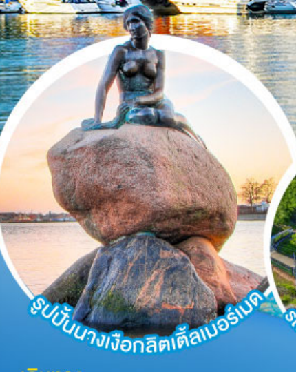
รูปปั้นนางเงือกลิตเติลเมอร์เมด