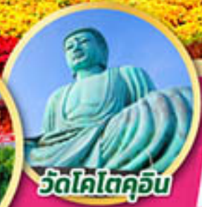
วัดโคโตคุอิน