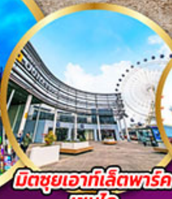
มิตซูเอากะไลท์พาร์ค เซนได