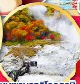
หุบเขารกจิโกกุคานิ