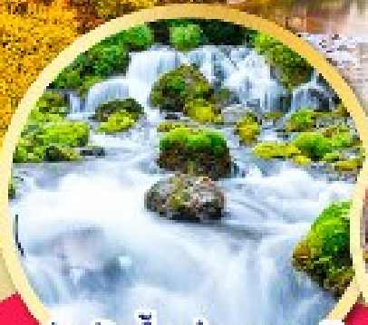
สันผืนน้ำแร่ธรรมชาติ ณ สวนฟูทาคาชิ