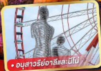
• อนุสาวรีย์อาลีและนีโอบี