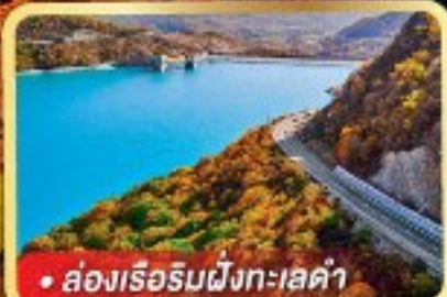
• ล่องเรือริมฝั่งทะเลดำ