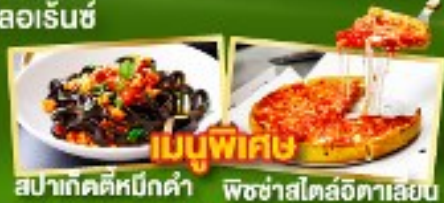
เมนูพิเศษ สปาคัดดีหมักดำ พิชซ่าสโตล์อิตาลี