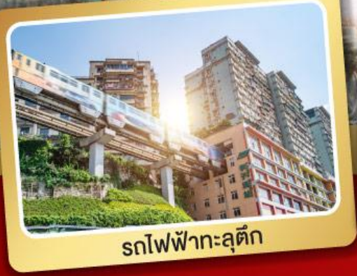
รถไฟฟ้ากระตุ๊ก