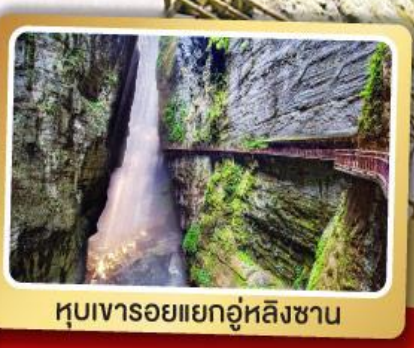
หุบเขารอยแยกอุ๋หลิงซาน