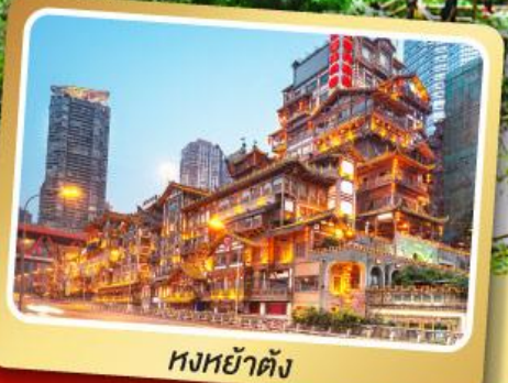
หงหย่าตัง