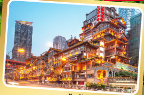
หงหย่าต้ง