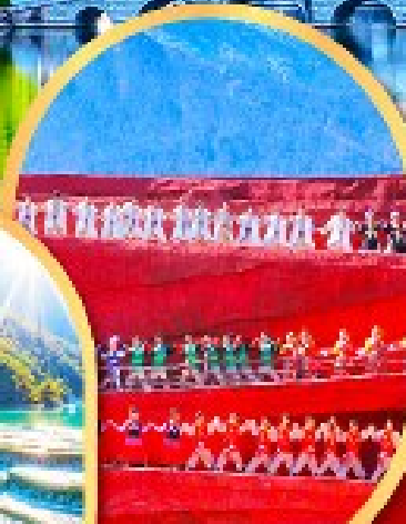
โชว์ Impression Lijiang