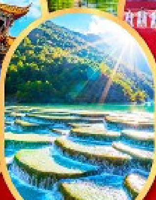
หุบเขาสีน้ำเงิน