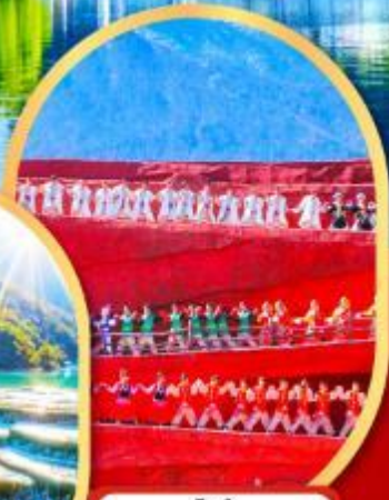
โชว์ Impression Lijiang