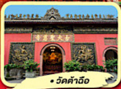
• วัดต้าอี้อ