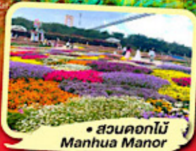
• สวนดอกไม้ Manhua Manor