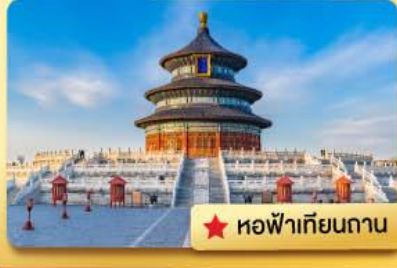
★ หอฟ้าเทียนถาน