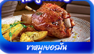
ขาหมูเยอรมัน