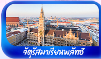
จัตุรัสมาเรียนพลัทซ์