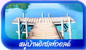
หมู่บ้านอิชเลทวอลด์