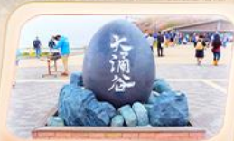
ซุบซาโด้ถ้ำอิวาคุดานิ