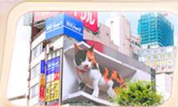
ซ็อบบิงย่านชินจูกุ