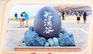
ชุมชนไร่ดำโอวาคุดานิ