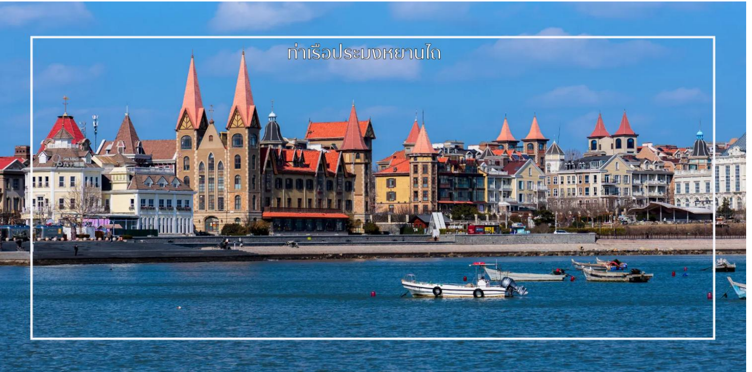
ท่าเรือประมงหยานไถ

นำท่านสู่ ท่าเรือประมงหยานไถ(ไห่ซาง) โดดเด่นด้วยตึกอิฐแดงสไตล์คลาสสิกที่ตั้งเรียงรายตัดกับสีฟ้าของน้ำทะเล เดินไปทางไหนก็เจอแต่มุมมองที่สวยงามๆเสน่ห์ของที่นี่คือความลงตัวระหว่าง "ความชิค" กับ "วิถีชีวิต" ครับ เราสามารถนั่งจิบกาแฟในคาเฟ่ มองดูเรือประมงที่จอดเรียงรายอยู่ในท่า พร้อมฝูงนกนางนวลที่บินวนไปมาได้ทั้งวัน