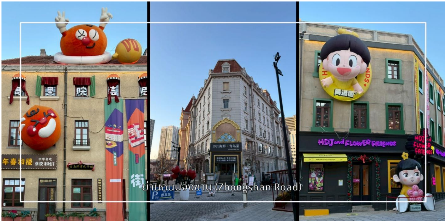
ย่านถนนจงซาน (Zhongshan Road)

นำท่านเดินชมบรรยากาศบน ถนนจงซาน (Zhongshan Road) ถนนสายเก่าแก่ใจกลางเมืองชิงเต่า ที่เต็มไปด้วยเสน่ห์ของอาคารสไตล์ยุโรปยุคอาณานิคมและกลิ่นอายเมืองท่าริมทะเลอันคึกคัก ถนนสายนี้ถือเป็นย่านการค้าสำคัญในอดีต ปัจจุบันเต็มไปด้วยร้านค้า ร้านอาหาร คาเฟ่ และร้านของฝากท้องถิ่นให้เลือกซื้ออย่างเพลิดเพลิน