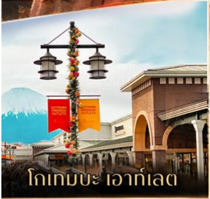
โทเทมบะ เอาร์ทเอด

✈ คอนเฟิร์มออกเดินทาง ตั้งแต่ 15 ท่าน ขึ้นไป