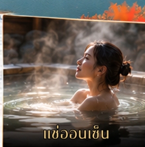
แช่ออนเซ็น