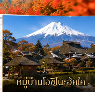
หมู่บ้านโอชิโนะฮักไค