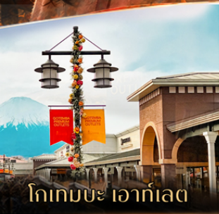
โกเทมบะ เอาก์เลต

คอนเฟิร์มออกเดินทาง ตั้งแต่ 15 วัน ขึ้นไป