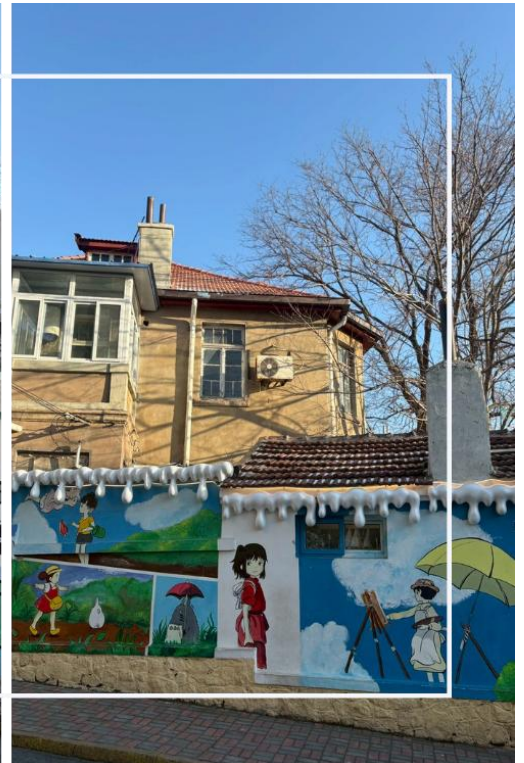
ถนนหลงเจียง (Longjiang Road)

นำท่านสู่ ถนนคนเดิน Silver Fish หรือที่รู้จักในชื่อภาษาจีนว่า “Yutai Road” ตั้งอยู่ในย่านใจกลางเมืองชิงเต่า เป็นหนึ่งในแหล่งท่องเที่ยวและแหล่งช้อปปิ้งยอดนิยมที่สะท้อนสีสันและวิถีชีวิตของคนท้องถิ่นได้อย่างชัดเจน ถนนสายนี้มีชื่อเสียง