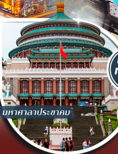
มหาศาลาประชาชน