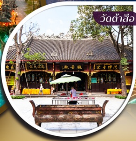
วัดต้าสือ