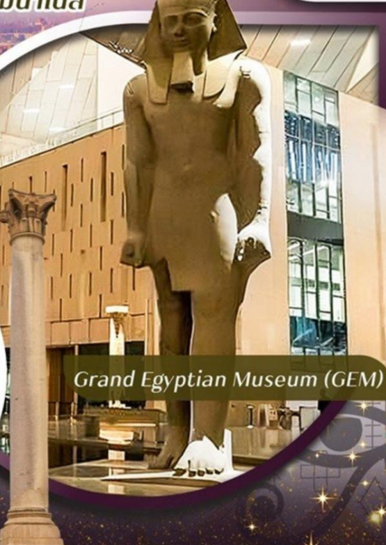
Grand Egyptian Museum (GEM)

คอนเฟิร์มออกเดินทาง ตั้งแต่ 15 ท่าน ขึ้นไป