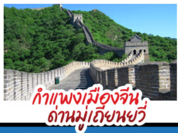
กำแพงเมืองจีน ด้านมู่เทียนยวี่

Universal Beijing - กำแพงเมืองจีนด้านมู่เทียนยวี่ (รวมกระเช้าขึ้น-ลง) พระราชวังโบราณกู้กง - หอฟ้าเทียนถาน - ซ้อมปิงกอนหวิ่งฟูจิ่ง และซานหลี่ถุน เมมูพิเศษ สุกิมองโก, เปิดปักกิ่ง, Michelin Guide ร้าน Tao Tao Ju