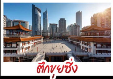
ตึกขุยซิ่ง

พระแกะสลักหินต้าจู้ - หลุมฟ้าสะพานสวรรค์ - เวนางฟ้า ตึกขุยซิ่ง - ตึกตะเกียบ - หมู่บ้านโบราณฉือซีโจว