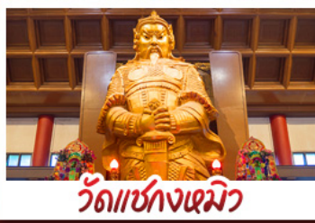
วัดซกขงหมิว