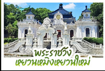
พระราชวัง เขวหนเหมิงเขวหนี่เหม่