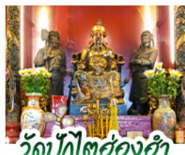
วัดปึกโตฮ่องกง