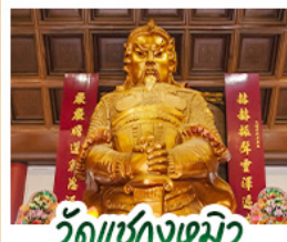
วัดเข่งหนิว