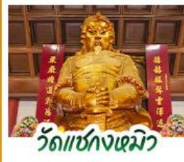
วัดเซกหงหิว