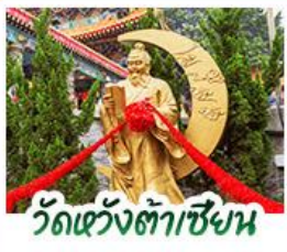
วัดเซ่งต้าเซียน