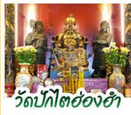
วัดปิกโตย่องฮา