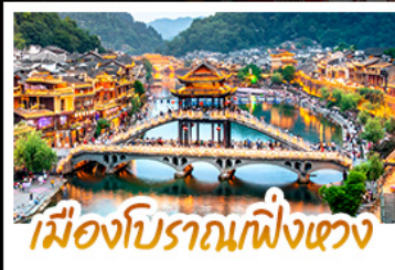
เมืองโบราณผิงเฉวง