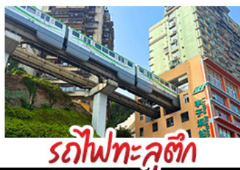
รถไฟทะลุคิ