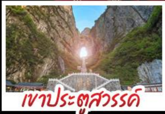
เขาประตูลั่วจื่อ