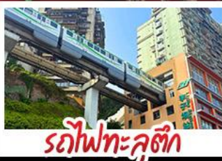
รถไฟทะลุคัง