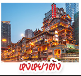
แดงหยาดัง