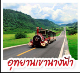
อุทยานเขาแดงฟ้า