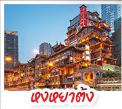
แดงหยาดัง