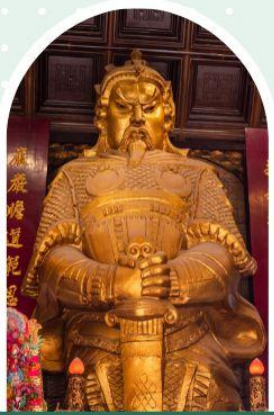
วัดเซกวง

"ไหว้พระ เสริมดวง เพิ่มสิริมงคลแก่ชีวิต"