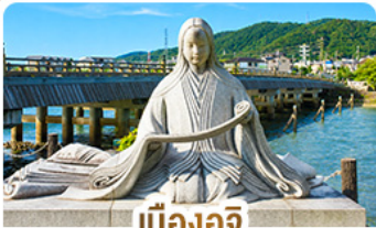
เมืองอูจิ สวรรค์คนรักชาเขียว

คามิโคจิ สวรรค์บนดินแห่งเทือกเขาแอลป์ ชมสะพานคิปปาบาชิ ชมวัดเนียวโดอิน • เมืองทาดายาม่า • ตลาดปลานิชิกิ • ช้อปปิ้งชินโซบาชิ • อีออนมอลล์