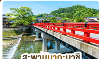
สะพานนากะบาชิ ทาดายาม่า