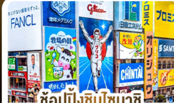
ช้อปปิ้งชินโซบาชิ และโดตงโมริ