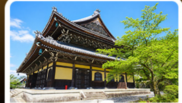
วัดนันเซ็นจิ