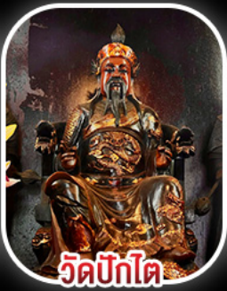
วัดปิกไค