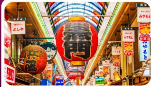
ตลาดปลาคุโรมง