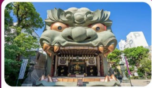
ศาลเจ้านัมมะ ยาชากะ