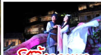
ชีวิตจิ้งจอกขาว