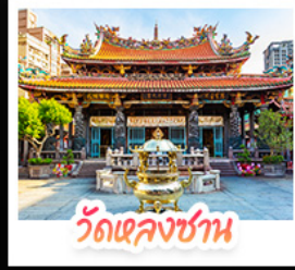
วัดเจหลงซาน