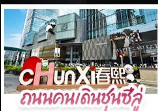
ชุนXิ熙 ถนนคนเดินชุนซู่