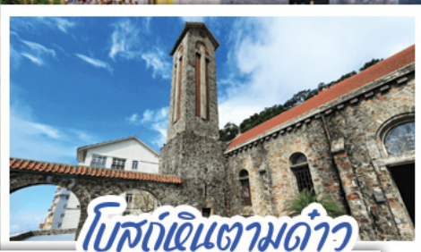
โบสถ์หินตามด้าว