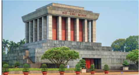
จัตุรัสบาติงห์