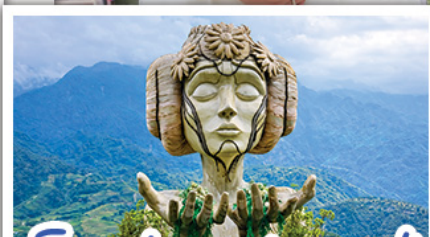
ไมอาน่า ซาปา ดาเฟ