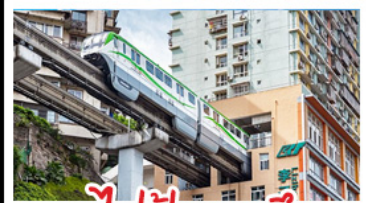
รถไฟฟ้าทะเลซุติค