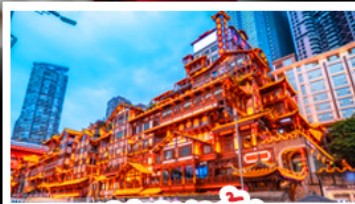
แดนเฉิงชิ่ง