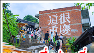
ตรอกซี้ซ่าวหลี่