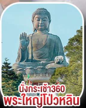
นั่งกระเช้า360 พระใหญ่ไป๋หวิน