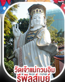
วัดเจ้าแม่กวนอิม รีพัลส์เบย์