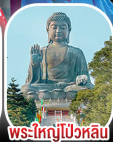
พระใหญ่โป้วหลิน