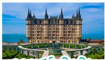
คฤหาสน์หวนเจิง

เมืองเก่าซิงเต่า - คฤหาสน์หวนเจิง เบียร์ซิงเต่า + อาหารทะเล สตรีทอาร์ต สตุตไอจิบลิ