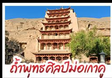
กำแพงศิลาปม่อเกาคู

เป็นทราจครวญ - สระน้ำงพระจันทร ทะเลสาบเกลือฉาซ่า - กำพุทศิลาปม่อเกาคู หุบเขาสายรุ้งจางเย่ - ทะเลสาบซิงไห่