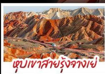
หุบเขาสายรุ้งจางเย่