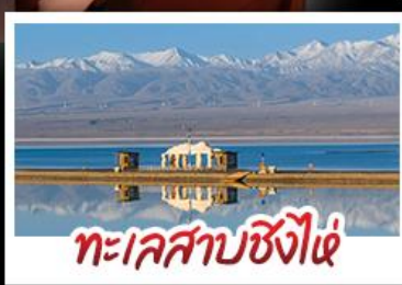
ทะเลสาบซิงไห่