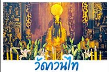
วัดกวนนิต

เที่ยวครบ แลนด์มาร์คดัง! โบสถ์เซนต์ปอล - เจ้าแม่กวนอิมริมทะเล THE VENETIAN - THE PARISIAN จุฬีฟิชเชอร์เก็รล - โรงละครหอยไข่มุก พระราชวังหยวนหมิงหยวน - วัดอาม่า - วัดกวนไท