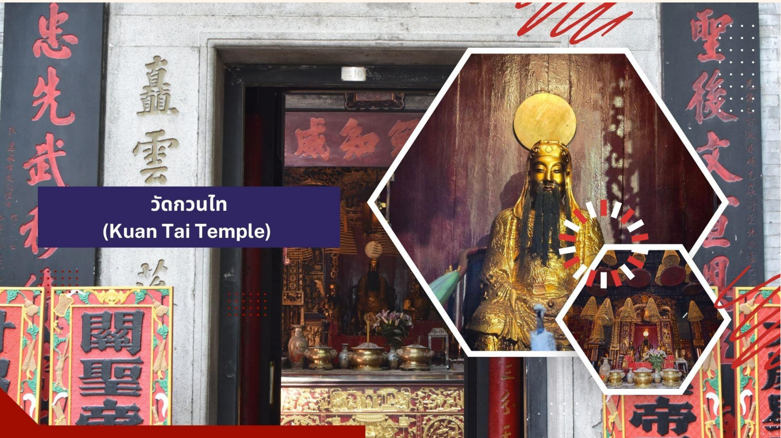
วัดกวนไท (Kuan Tai Temple)

เซนต์ปอลสร้างขึ้นในปี ค.ศ. 1580 แต่ถูกทำลายถึงสองครั้ง ในปี ค.ศ.1595 และ ค.ศ.1601 ตามลำดับ จนกระทั่งเกิดเพลิงไหม้ในปี ค.ศ. 1835 ทั้งวิทยาลัย และโบสถ์ถูกทำลายจนเหลือแต่ด้านหน้าของตึกฐานโบสถ์ส่วนใหญ่และบันไดด้านหน้าของตึกแสดงให้เห็นถึงสไตล์ผสมระหว่างตะวันออกและตะวันตกและมีอยู่ที่นี่เพียงแห่งเดียวเท่านั้นในโลก