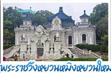
พระราชวังเซวานเซมิงเซวานนิตเซม